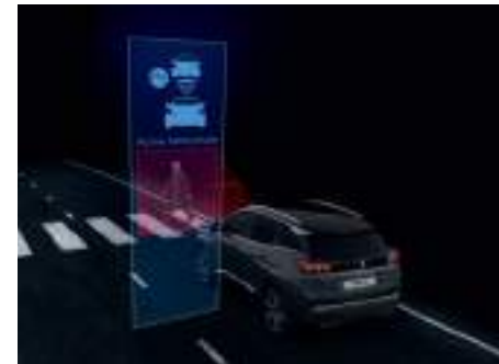
Active Safety Brake النظام النشط لمكابح الأمان