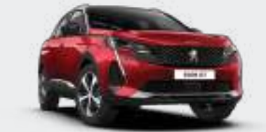
Ultimate Red أحمر أليمت