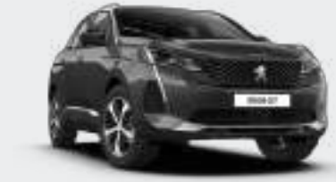
Platinum Grey رمادي بلاتينيوم