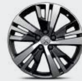
18" ALLOYS "DETROIT", diamond cut, Michelin Primacy 3 عجلات الألومنيوم "ديترويت" بقياس 18 بوصة، قصة ألماسية، ميشلان برايمسي 3