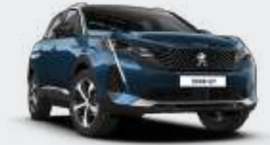
Celebes Blue أزرق سيليس

اختر لونك المفضل من مجموعتنا التي تضم سبعة ألوان مذهلة.