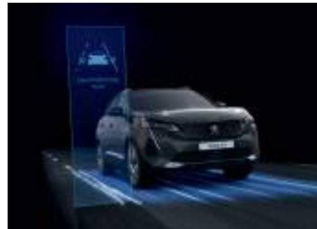
Lane Positioning Assist النظام النشط لتحديد التمرکز في المسار