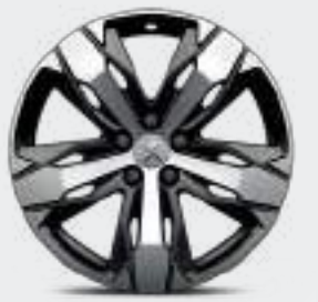
18" ALLOYS, "LOS ANGELES", diamond cut, Continental CCLX2 عجلات الألومنيوم "لوس أنجلوس" بقياس 18 بوصة، قصة ألماسية، كونتيننتال CCLX2