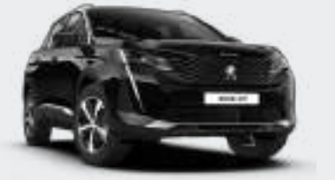
Black Perla Nera أسود لؤلؤي نيرا