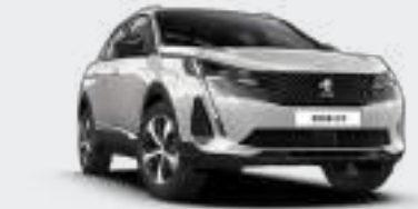
White Pearl أبيض لؤلؤي