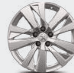
17" ALLOYS "CHICAGO", Michelin Primacy 4 عجلات الألومنيوم "شيكاغو" بقياس 17 بوصة، ميشلان برايمسي 4

اختر ما بين عجلات الألومينيوم بقياس 17 بوصة أو 18 بوصة، واستمتع بمزيد من الفخامة والتألق.