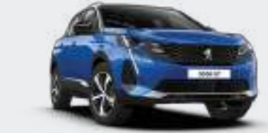
Blue Vertigo أزرق فرتيجو