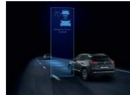
Adaptive Cruise Control نظام تثبيت السرعة القابل للتكيف