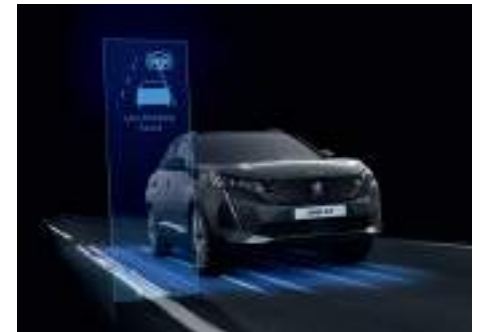
Lane Keep Assist نظام تنبيه الانحراف