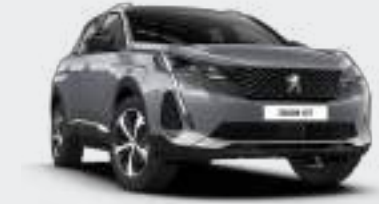
Cumulus Grey رمادي كومولس